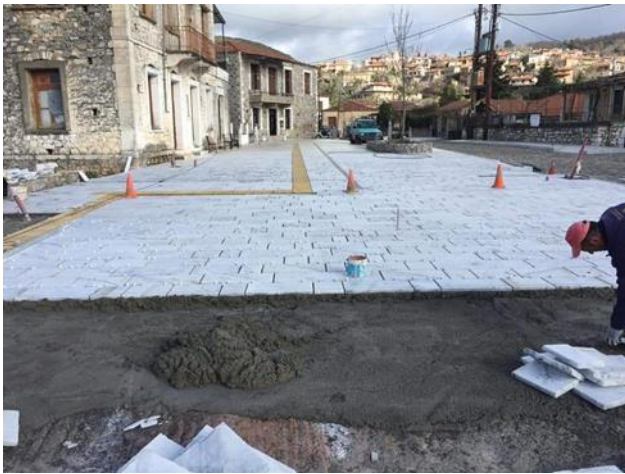
Η ολοκλήρωση της πλακόστρωσης

Στο χέρι των δύο καταστημάτων εστίασης που λειτουργούν στη Ράχη είναι να εκμεταλλευτούν τον χώρο και να δημιουργήσουν ένα δεύτερο πόλο αναψυχής στο χωριό μας.