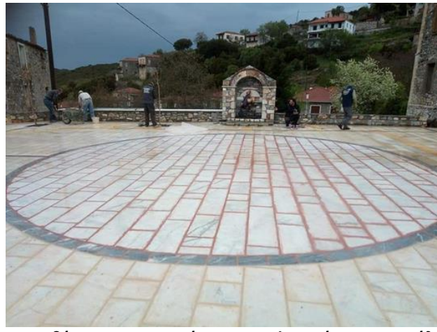
Η τοποθέτηση των μαρμάρινων επιφανειών στα πεζούλια εκατέρωθεν της κρήνης.