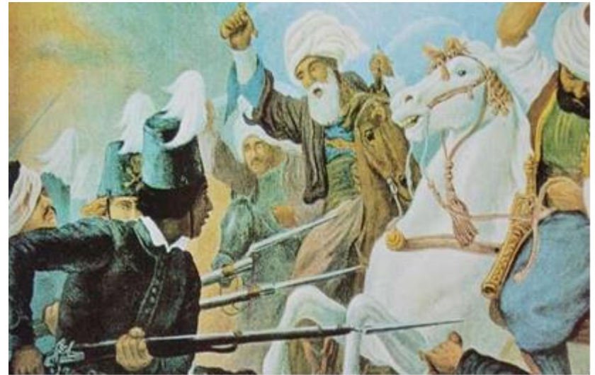
Η μάχη του Δραγατσανίου