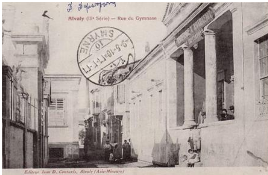
Φωτογραφία της μεγάλης σχολής των Κυδωνιών της Μικράς Ασίας στις αρχές του 20 ου αιώνα