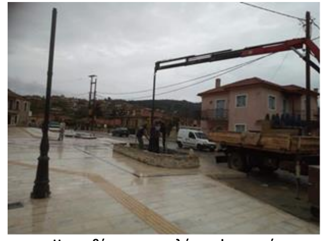
Η τοποθέτηση των πυλώνων φωτισμού