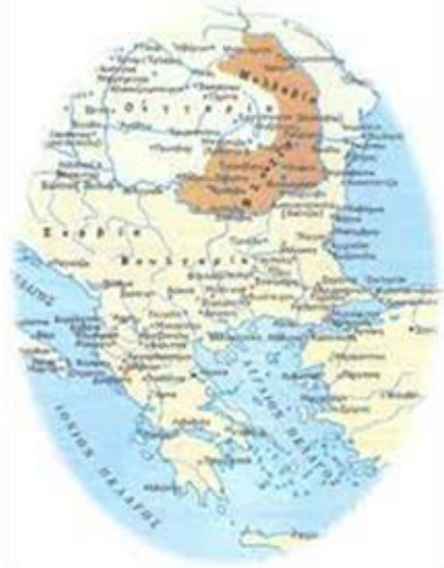
Η περιοχή της Μολδοβλαχίας

Μετά από την ολοκλήρωση των σπουδών τους μετακινούνται στην Κωνσταντινούπολη , όπου ο Δημήτριος θα ασχοληθεί με το εμπόριο. Όμως ο Χαράλαμπος, διψασμένος για περαιτέρω γνώση ακολουθεί την πορεία των υπόλοιπων φωτισμένων υπόδουλων Ελλήνων ταξιδεύοντας στις μεγάλες πόλεις της Ευρώπης για να γνωρίζουν τον Δυτικό Πολιτισμό που τόσο τους ενθουσίασε μέσα από τα συγγράμματα που σπούδασαν: επισκέπτεται κατά σειρά τη Ρώμη , τη Βενετία , την Πίζα , τη Πάδοβα και τέλος το Παρίσι , όπου γνώρισε και τον μεγάλο δάσκαλο του Γένους τον Αδαμάντιο Κοραή .