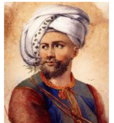
Ο Ιμπραήμ πασάς

Επιστρέφοντας πάλι στην Τρίπολη, σχεδιάζει να επιτεθεί ο ίδιος στην Μάνη από τα ανατολικά. Όμως οι Λάκωνες έχουν ξαναστήσει το στρατόπεδο των Βερβένων και η προσπάθειά του να περάσει από εκεί του προκαλεί μεγάλη αιμορραγία με διακόσιους νεκρούς. Για τον σκοπό αυτό τον Ιούλιο προχωρεί μέσω Καστρίου και Αγίου Πέτρου προς το Άστρος , όπου όμως βρίσκει αντίσταση από τον Νικητάρη .